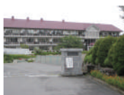
立科中学校 徒歩約21分(約1.7km)

掲載の建物プランはおお客様の参考としていただくための一例です。プランはご自由にお選びいただけます