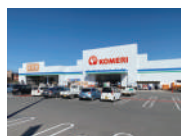
コメリ立科店様 車約7分(約3.3km)