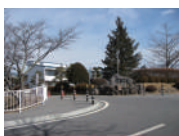
立科小学校 徒歩約18分(約1.5km)