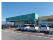
ソルヤ立科店様 車約7分(約3.3km)